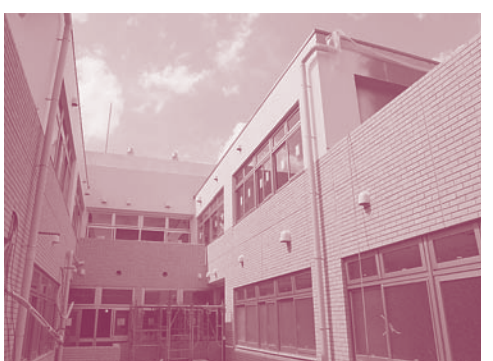
広い吹き抜けが2ヶ所に