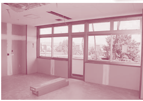
明るい病室からの眺め

問合せは吉田病院看護部長室まで TEL 0742-45-4601(代) Email: shichoushitsu@heiwakai.or.jp